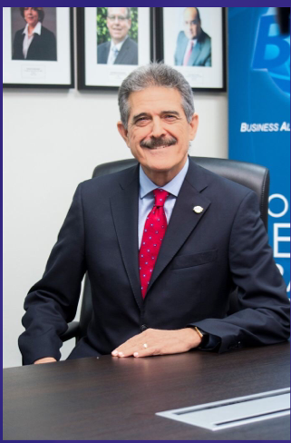
Presidente Internacional WORLD BASC ORGANIZATION Fermín Cuza

“La pandemia del COVID-19 provocó un mundo de gran incertidumbre de tipo personal y financiero, al igual que puso al descubierto grandes brechas de injusticia económica y social alrededor del mundo, de las que todos fuimos testigos.”