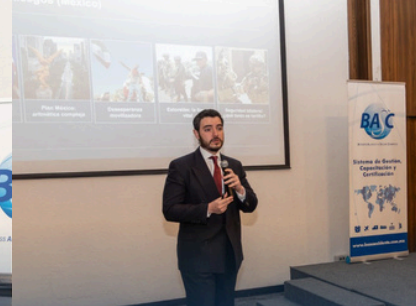
SATLOCK 1 AÑO CERTIFICADA