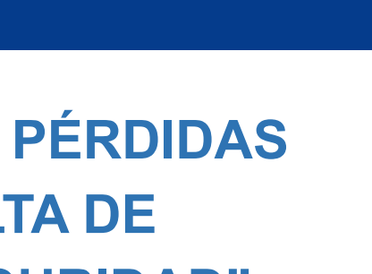
INTER-CON 8 AÑOS CERTIFICADA