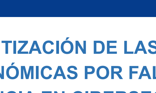
JUNTA DE MEJORES PRÁCTICAS