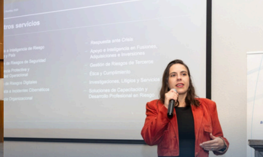
DIMAC 13 AÑOS CERTIFICADA