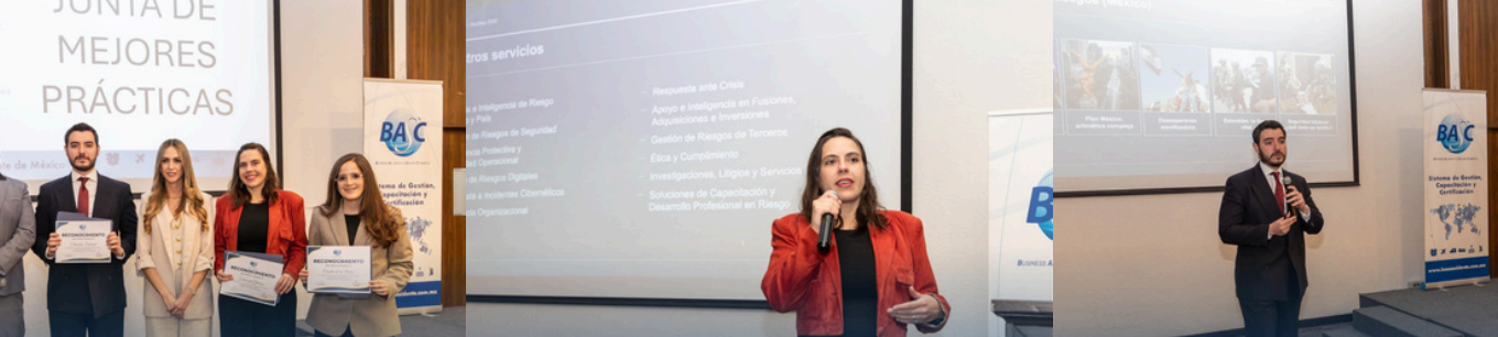
SOLUCIONES SEVER 5 AÑOS CERTIFICADA