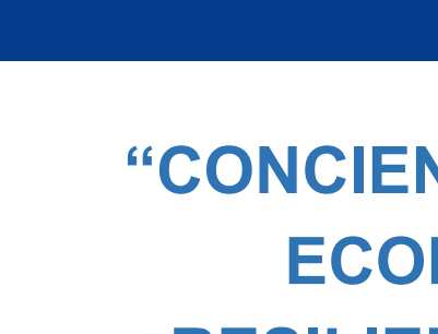
JABIL 21 AÑOS CERTIFICADA